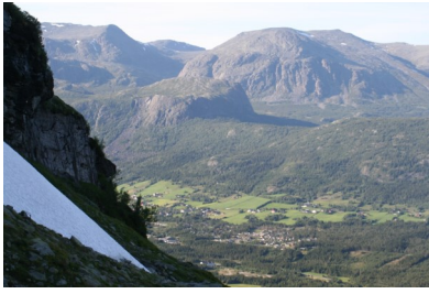
Frå «Nordsida» i Hemsedal