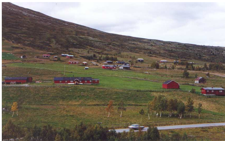
Oversiktsbilde over Jordheimsstølane.

Eit aktivt jordbruk medfører at driftsbygningar og andre hus på gardane er tilpassa drifta. Gamle bygningar er ofte ombygde eller erstatta med nye meir praktiske bygg. Det er difor ikkje teke vare på mange gamle bygningar og tun i dalen. Inntektene frå landbruket gir i dag ikkje nok overskot til at ein kan koste så mykje på vedlikehald av desse bygningane. Derfor bør det vere mogleg å få tilskot til vedlikehald.