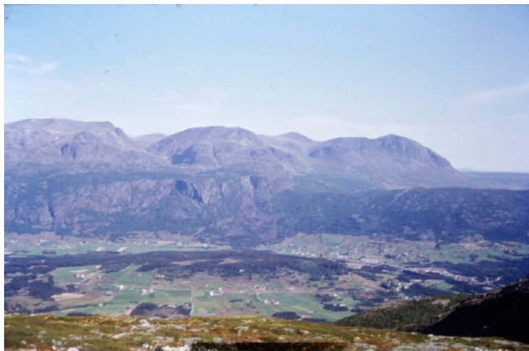
Oversiktsbilde over Hemsedal. Bildet er tatt frå Såta av Knut Olav Halbjørhus

Offentleg finansiering av slike anlegg er organisert gjennom Enova SSF og bioenergi-programmet i Innovasjon Noreg.