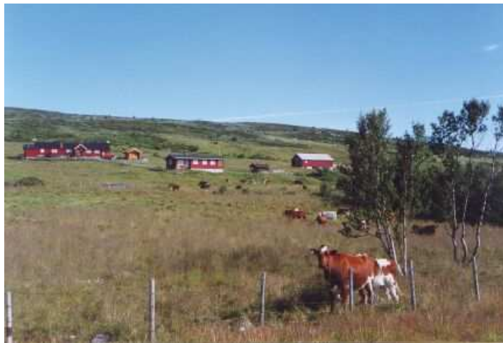
Bilde av Jonstølane.

Landbruket har vore og er hovudleverandør av råtomter til hytter. Tomtene er frådelt som enkelttomter spreidd rundt i skog og fjellområde eller i felt med meir konsentrert bygging. I starten var det meir spreidd utbygging med romslege tomter. I framtida bør hyttebygging hovudsakleg skje ved fortetting og utvikling av allereie bygde felt. I tillegg bør landbruket og det lokale næringslivet i sterkare grad arbeide for å utvikle råtomter lokalt slik at så stor del som mogleg av verdiskapinga blir lokalt. Mest mogleg må i framtida foredlast og utviklast lokalt.