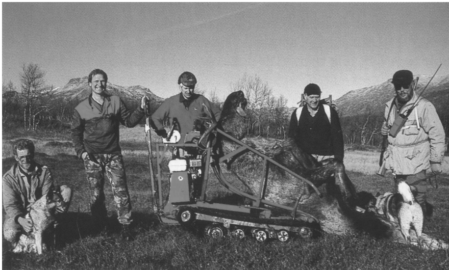
Moderne elgjakt. Den såkalla jarnhesten er grei å transportere på.

I mange fjellvatn og elvar i Hemsedal er det høve til å kjøpe fiskekort. Hemsedal fiskeforeining sitt fiskekort dekkjer storparten av desse vatna samt elvene nede i bygda. Elva Heimsil som renn gjennom hovuddalføret er svært populær blant sportsfiskarar, dette grunna fin kvalitet på fisken og gode strekningar for flugefiske. Totalt sel fiskeforeininga kring 4000 fiskekort i året. I mange av fjellvatna blir det teke ut ein del fisk ved garnfiske, og mykje av fangsten blir nytta til blant anna rakefiskproduksjon.