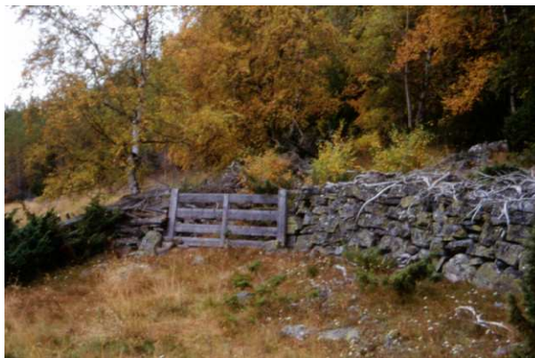
Bilde av kulturminne ved Rundtop 55/13. Steingjerde som kan sjåast når ein går Finnstigen.

Fylkesmannens landbruksavdeling i Buskerud (FMLA) har kontrollansvar overfor kommunen. FMLA skal bidra med oppfølging og fagleg ekspertise.